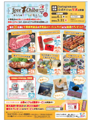
キャンペーンポスター