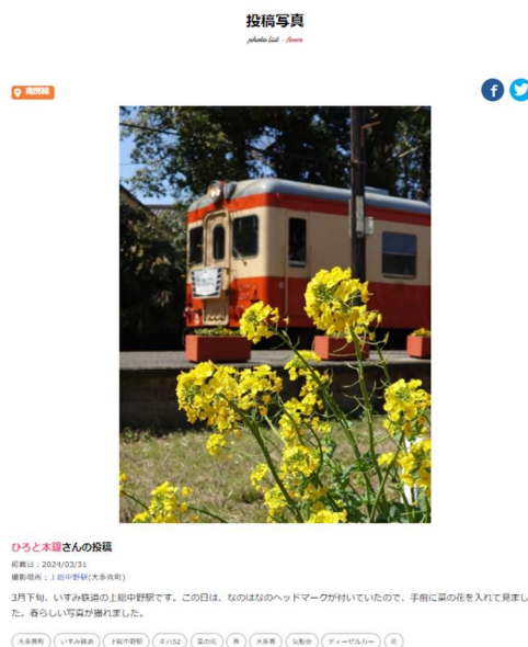
キャンペーンサイトの画面

さらに、地域での消費拡大に結び付けるため、投稿写真の撮影場所周辺に所在するラブちば優待サービスの提供施設が同時に表示されるようなサイトデザインとした。