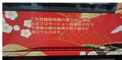
第 1 号機 (幕張メッセ)