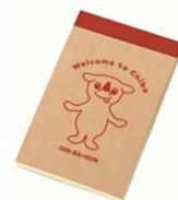
チーバくんメモ帳

県、観光物産協会、JR東日本千葉支社、旭市、多古町、匝瑳市、東庄町観光協会、君津市、外房観光連盟、南房総観光連盟、銚子市、成田市、柏市(パンフレット配架のみ)